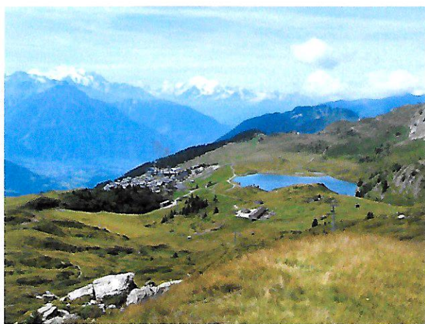
Die Bettmeralp mit dem Bettmersee

Unser Hotel liegt ca. 10 Gehminuten von der Gondelbahnstation entfernt an der Hauptstrasse, die sich durch den Ort zieht. Der Transport unseres Gepäcks wird vom Hotel bewerkstelligt. Alle Zimmer verfügen über Dusche/WC oder Bad/WC, TV, Direktwahltelefon, Minibar und Minisafe. Adresse des Hotels: Hotel Alpfrieden, 3992 Bettmeralp, Telefon 027 927 22 32; www.alpfrieden.ch . Ein Frühstücksbuffet und das 5-Gang-Abendessen werden für unser leibliches Wohl sorgen. Beim Rekognoszieren haben wir einen sehr guten Eindruck von den Künsten des Hotelkoches erhalten. Wer will, kann die Badehose mitnehmen, vielleicht für einen Besuch im Hallenbad (Gratiseintritt) oder, bei entsprechender Witterung, im nahe gelegenen Bettmersee. Ganz in der Nähe lädt auch eine Minigolf Anlage zum Besuche ein.