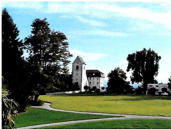
Blick von unserem Hotel seewärts

Für den Ausflug nach Deutschland bitte Pass oder ID mitnehmen, Euro nach Bedarf.